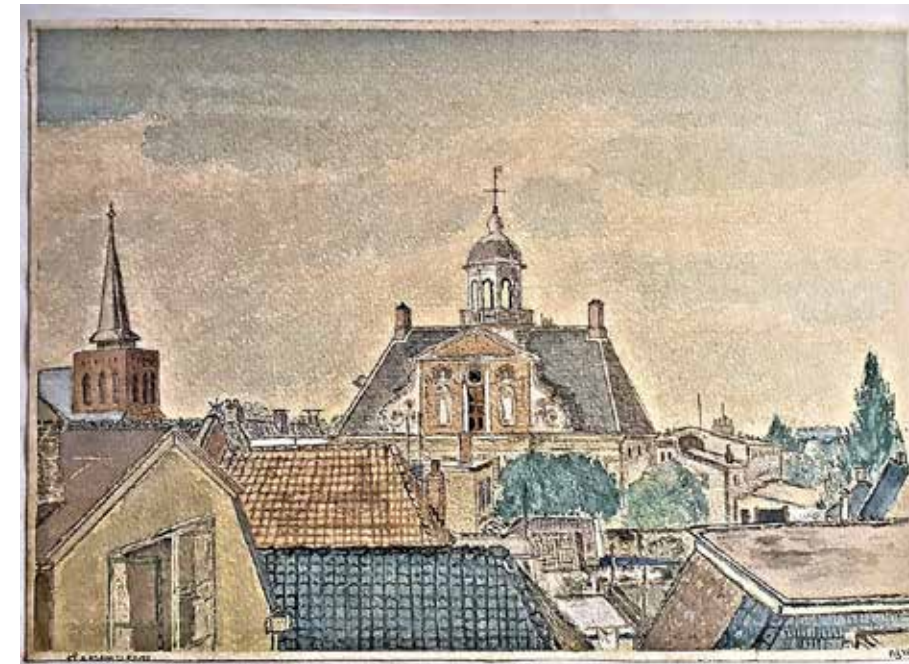
Aquarel gemaakt door Ys Sevensma, vlak voordat hij verhuisde naar Amsterdam

Bij de sloop in 1972 van de Schoterlandse Kruiskerk, die tegenover het Posthuis Theater stond en waar nu de fundering