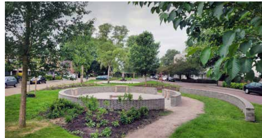
Het grasveldje aan de Jan Mankeslaan werd een heuvelachtige terrein met veel begroeiing en gestapelde tegels.