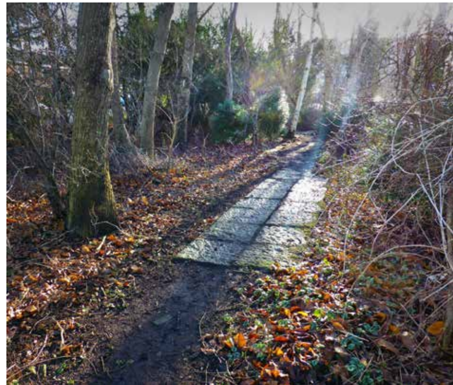
Vloertegels van Protestantse Kruiskerk in de Le Roy tuin